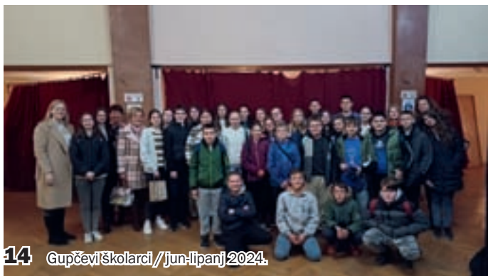
14 Gupčevi školarci / jun-lipanj 2024.

Bili smo i na predstavi „Ne očajavajte nikad“ Branislava Nušića u Narodnom pozorištu u Subotici.