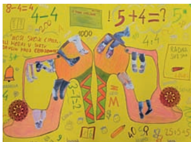
Odeljenje 2/3. d; OŠ „Matija Gubec“, Tavankut; Mentor Slavica Pokornić