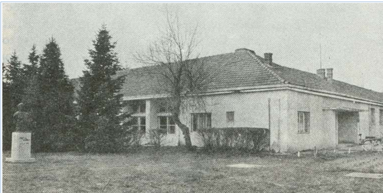
centru Donjeg Tavankuta).